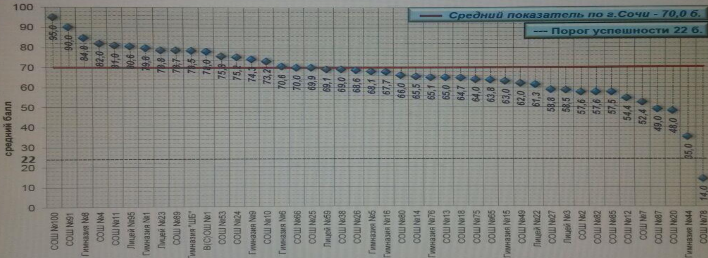
Результаты ЕГЭ-2017 общеобразовательных организаций города Сочи Английский язык (251 чел.)