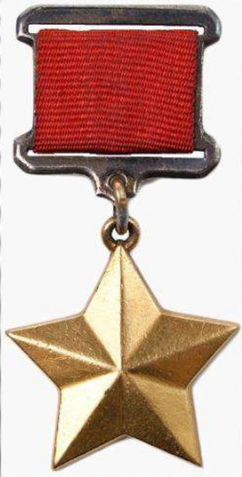
Медаль «Золотая Звезда».

Приказом Верховного Главнокомандующего от 1 мая 1945 года Ленинград вместе со Сталинградом, Севастополем и Одессой был назван городом-героем за героизм и мужество, проявленные жителями города во время блокады. 8 мая 1965 года Указом Президиума Верховного Совета СССР Город-герой Ленинград был награждён высшими наградами советского времени орденом Ленина и медалью «Золотая Звезда».