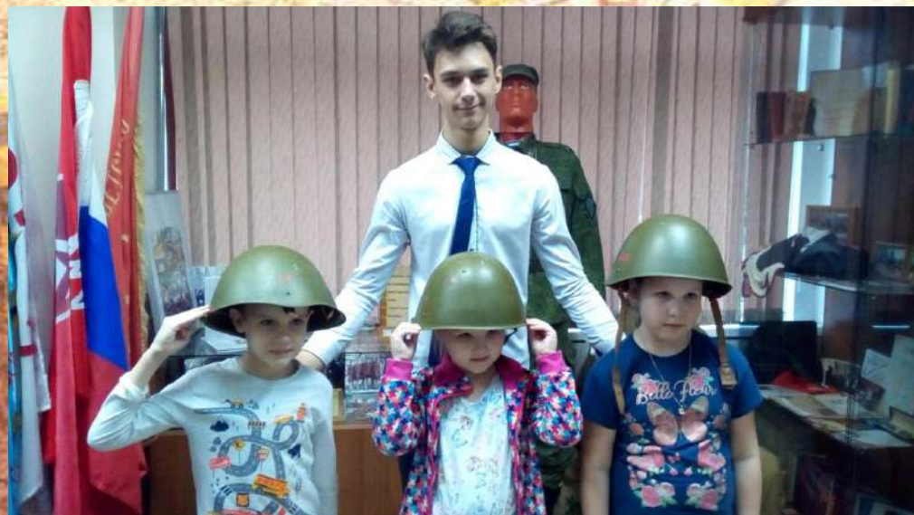
Экскурсоводы и гости разных лет