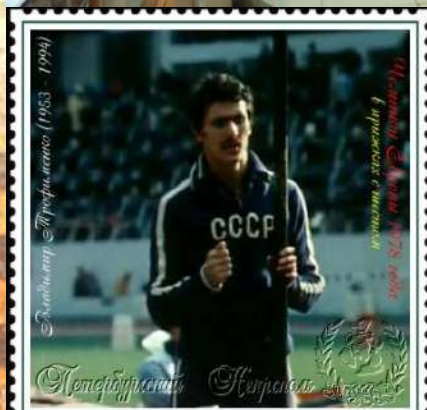
ТРОФИМЕНКО ВЛАДИМИР ИВАНОВИЧ, советский прыгун с шестом, чемпион Европы 1978 г.